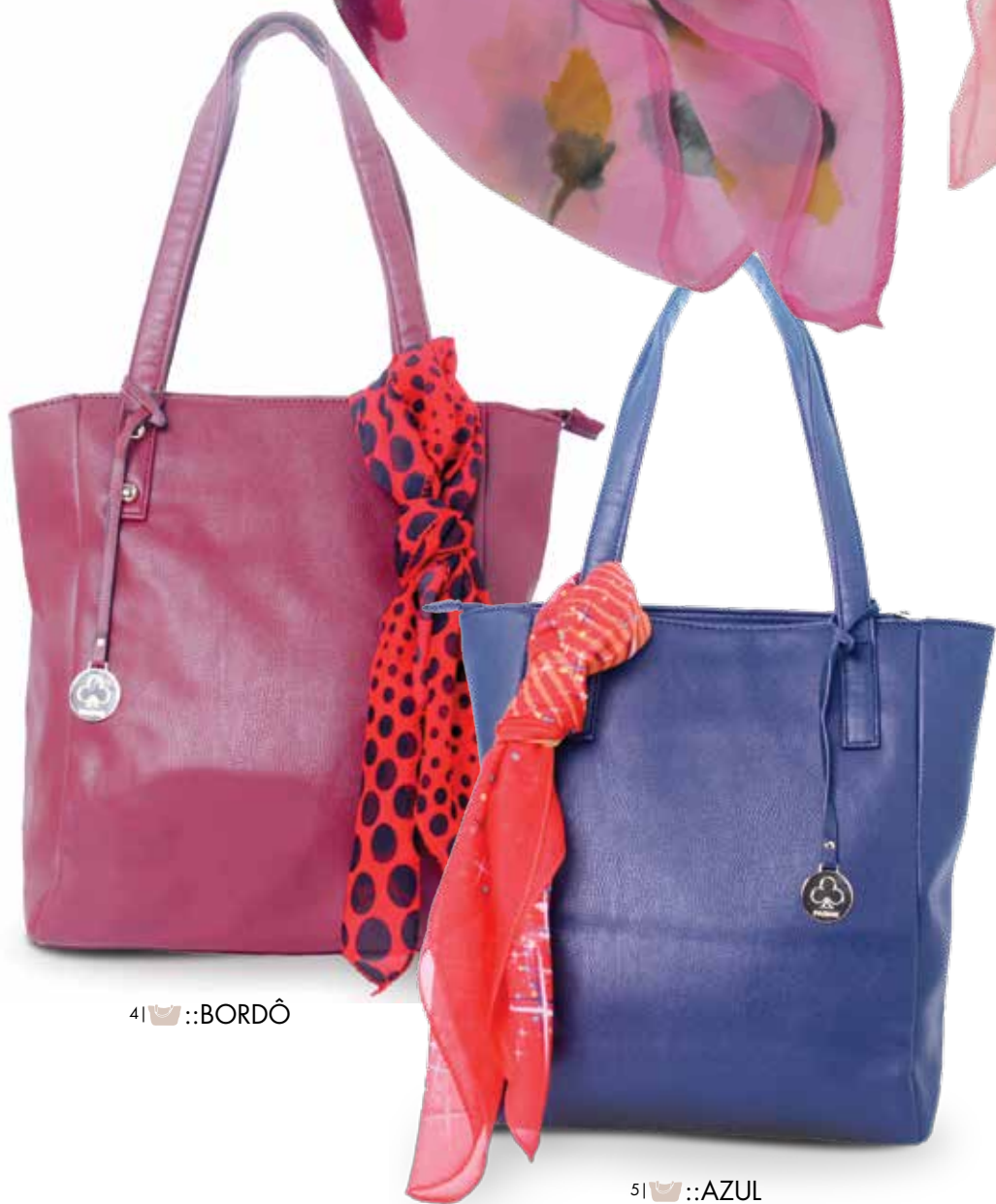
41 🐝 :: BORDÔ