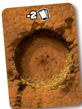
CARTA DE CRÁTER

Si un jugador entra en una carta de cráter , pierde dos cartas de su mano (a su elección) y las deja en la pila de descarte.