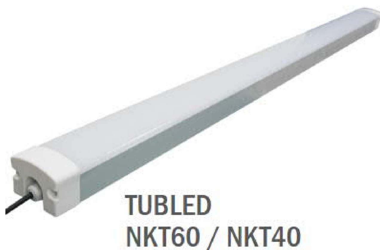
TUBLED NKT60 / NKT40