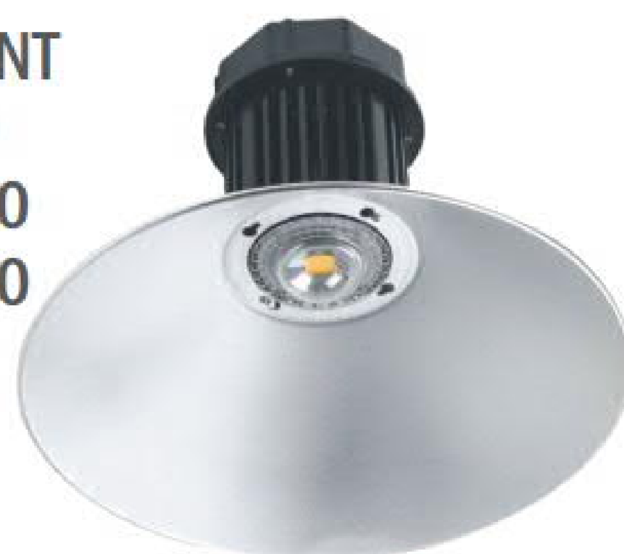
PENDANT NKP60 NKP120 NKP200