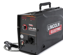
K2614-9 LN-25 Ironworker®