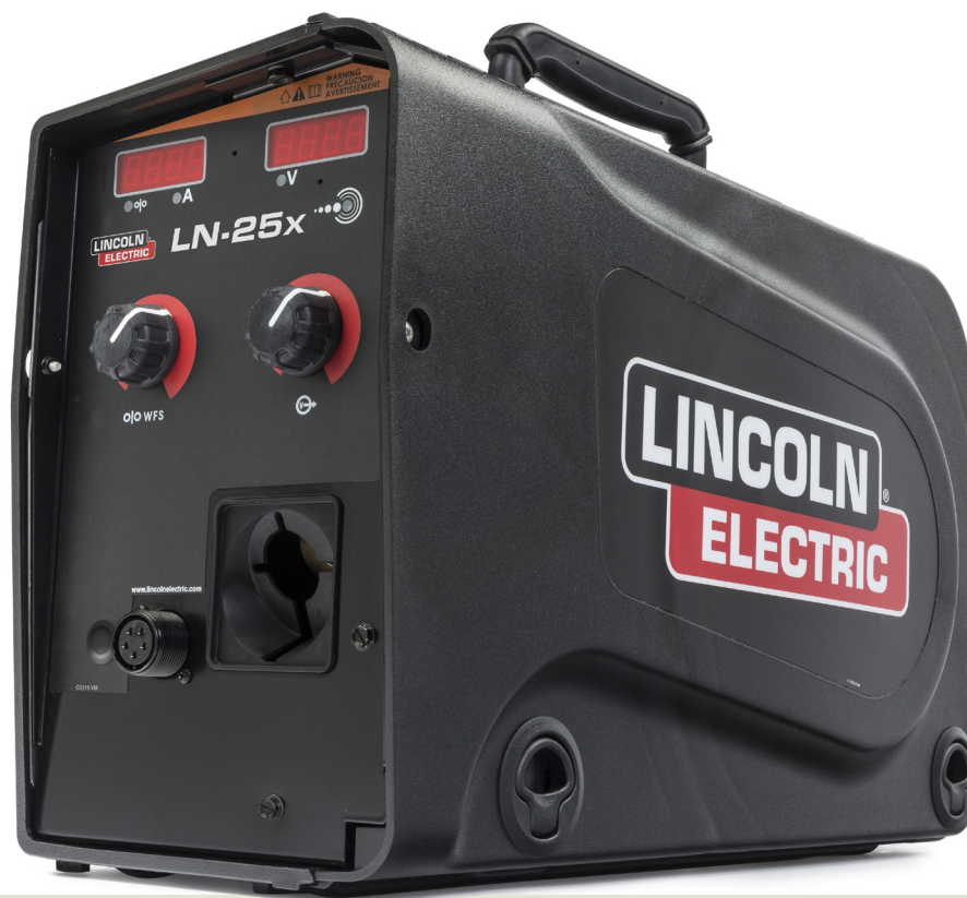
Se Muestra: LN-25X con CrossLinc™ K4267-1