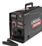
K2613-7 LN-25 PRO Extra Torque