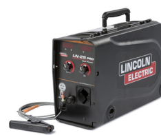
K2614-6 LN-25 PRO Dual Power