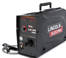
K2614-5 LN-25 PIPE