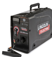
K2613-5 LN-25 PRO Standard