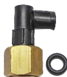
22-172 Niple salida de tanque C/codo plástico (1/4)