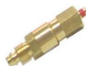
22-168 Válvula de cámara corta p/ Manguera 1/4"