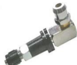
22-065 Salida carrocería C/conexión resorte