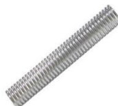
22-059 Resorte de bajada cromado