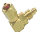
22-167 Válvula de cámara codo p/manguera 1/4"