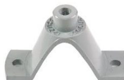
22-096 Soporte de rotor pirámide M. Benz Atego