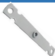
22-078 Soporte de rotor RF barra Mercedes Benz 1633/1938/1941