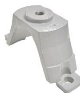
22-100 Soporte de rotor pirámide Fiat cursor