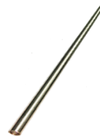
Caño inoxidable 5/8 NE-0085 45 cm NE-00135 55cm NE-00136 65cm NE-00138 100cm