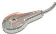
22-146 Taza cubre rotor Cromada c/codo