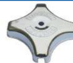
22-518 Taza cromada interno