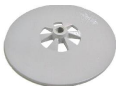
22-094 Soporte de rotor Disco de 245 mm