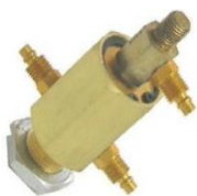
22-062 Rotor de bronce Rosca fina