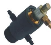
22-063 Rotor de plástico externo Rosca gruesa