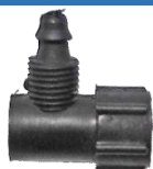
22-040 Niple de plástico p/manguera 1/4"