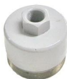
22-098 Soporte de rotor fundición MB 608