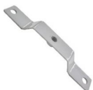
22077 Soporte de rotor barra M.Benz 115 ED