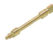
22-169 Válvula de cámara larga p/ Manguera 1/4"