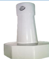
22-561 Llave p/ajustar taza c/rosca interno