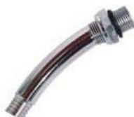
22-291 Codo c/tuerca p/taza cobre rotor externo cromada