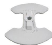
22-101 Soporte de rotor mariposa 210MM