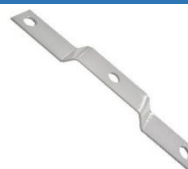
22-080 Soporte de rotor barra Volvo 340/380/440 eje delantero