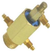
22-193 Rotor de bronce Rosca gruesa