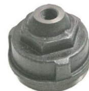
22-097 Soporte de rotor fundición MB 1114/1633