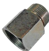
22-011 Prolongador 25 mm Rosca gruesa