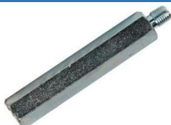
22-325 Esparrago p/camión 1114 (5/8x94mm)