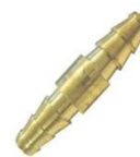
22-046 Niple unión (-) De bronce