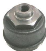
22-099 Soporte de rotor fundición M. Benz linea700