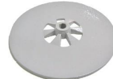
22-093 Soporte de rotor disco De 210 mm