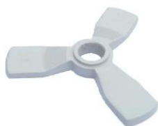
22-095 Soporte de rotor Estrella 3 vertices