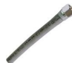
22-958 Conector inferior para bajada