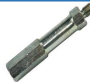
22-936 Esparrago R1 1-2x20; R2 3-8x24; D1 8-1; D2 3-4