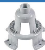
22-083 Soporte de rotor barra Campana chica MB 1517 EM