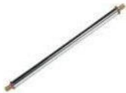
22-962 Caño con terminal de 32cm 22-963 42cm 22-964 55 cm 22-965 65cm