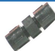
22-047 Niple unión recto de Plástico (-) c/tuercas 22-192: Niple unión 5/16