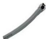
22-957 Conector superior para bajada