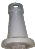
22-199 Llave p/ajustar cono c/rosca