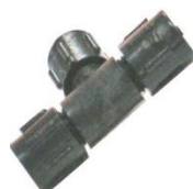
22-048 Niple unión T 1/4 22-191 Niple T 5/16