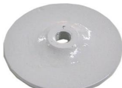
22-091 Soporte de rotor disco De 130mm