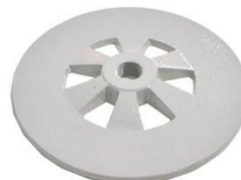
22-092 Soporte de rotor disco De 165mm (rosca fina)