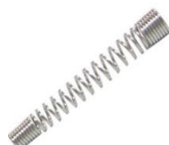
22-058 Resorte cónico p/manguera Espiralada 1/4 NE-00145 Resorte cónico p/mang. 5/16