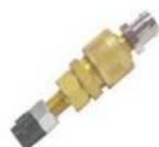
22-164 Válvula conexión completa p/ manguera 1/4 NE-00124 5/16