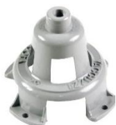
22-088 Soporte de rotor Campana randon acopl o semi 4 agujeros