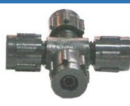
22-045 Niple unión cruz (+)