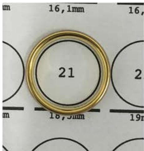
Essa é a forma correta